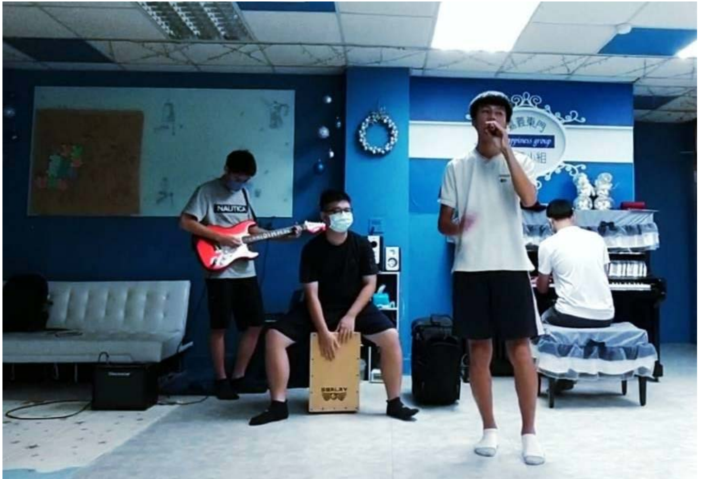
4.(照片備註說明) 原創音樂團體每次於現場表演專業的籌備、突破瓶頸與合作無間的畫面