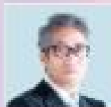
白成豐 日本國立大學 教育學部教授