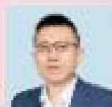
梁俊 中國華南師範大學 教育學院院長 教育部特聘教授