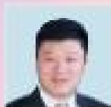
高國強 中國社會科學院 教育研究所副所長 國家高級專家