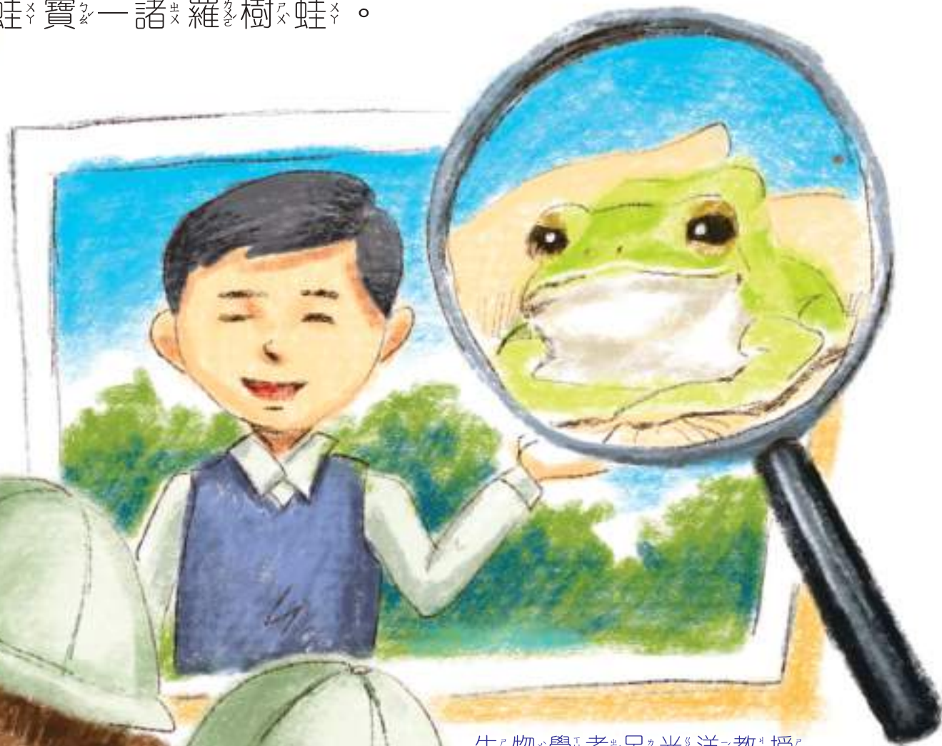
生物學者呂光洋教授

呂伯伯：這就是1995年由生物學者呂光洋教授在嘉義發現的臺灣特有種，用嘉義古地名「諸羅」來命名，分布在雲林、嘉義、臺南，在嘉義市北香湖公園有完整保留棲地，現在已被列為瀕危物種的蛙寶——諸羅樹蛙。