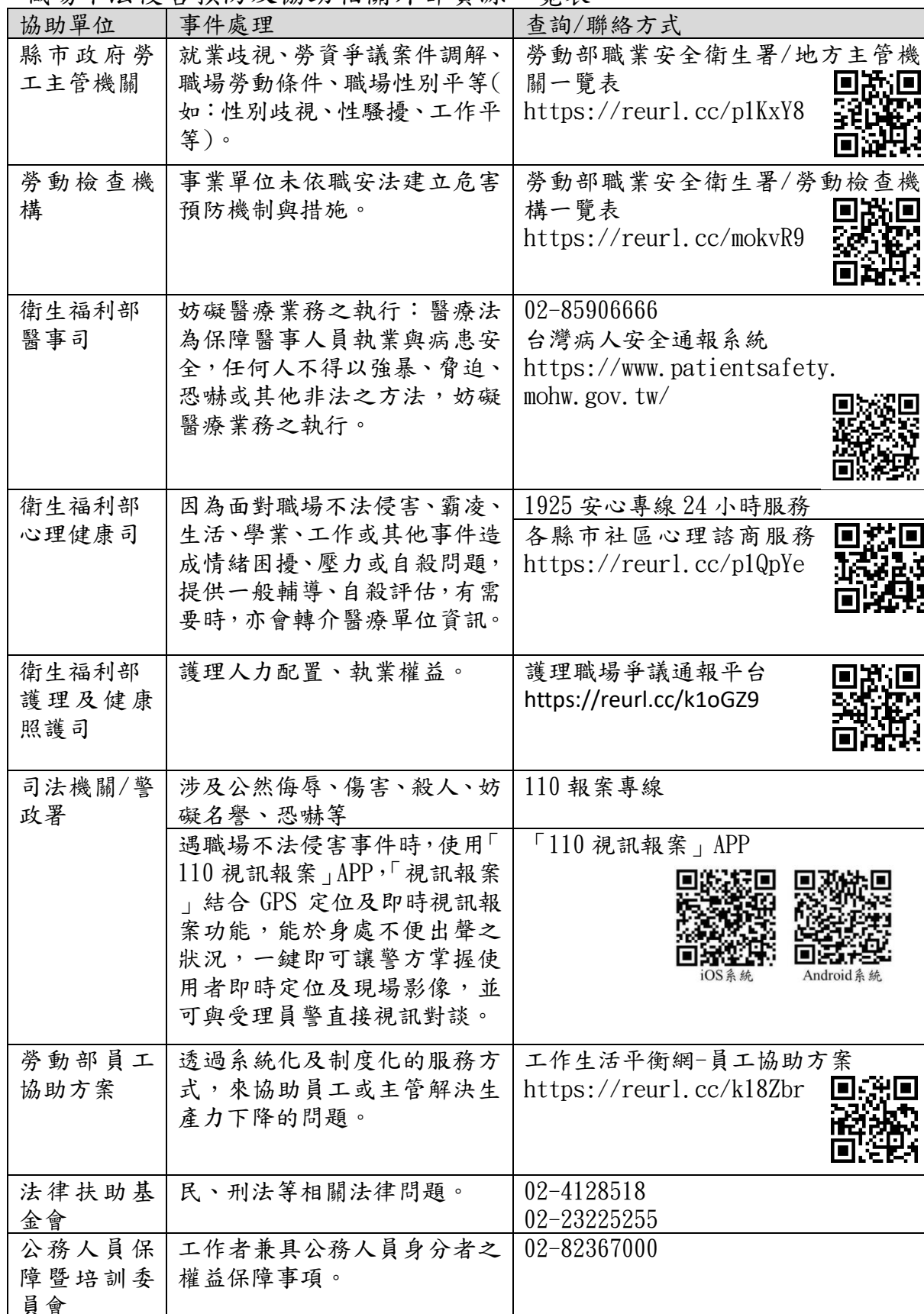
職場不法侵害預防及協助相關外部資源一覽表