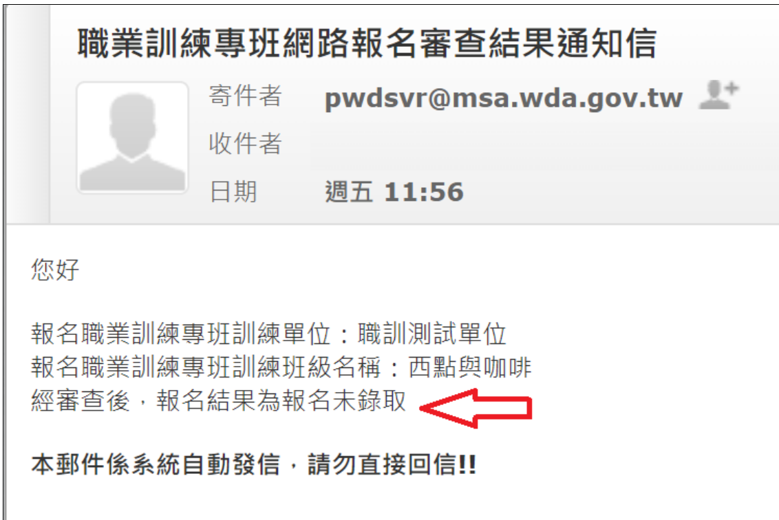
圖 4.3.1.3 報名未錄取通知信畫面

(6).學員報名成功，系統將發信通知報名者錄取，出現圖 4.3.1.4 報名成功通知信畫面。