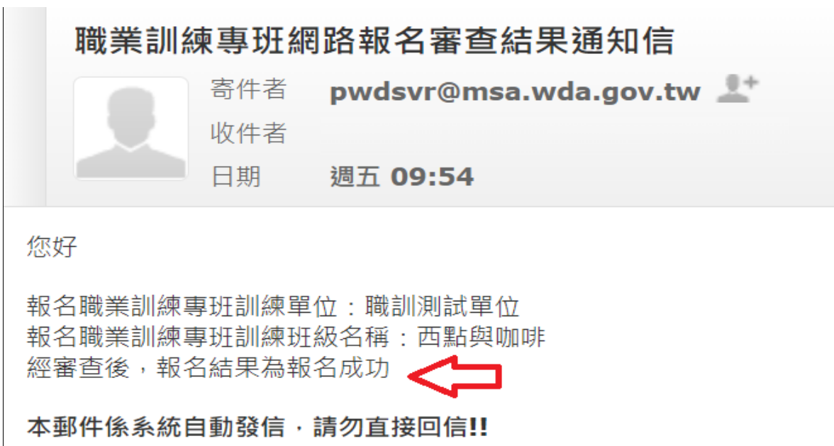
圖 4.3.1.4 報名成功通知信畫面

(6).學員報名成功，系統將發信通知報名者錄取，出現圖 4.3.1.4 報名成功通知信畫面。