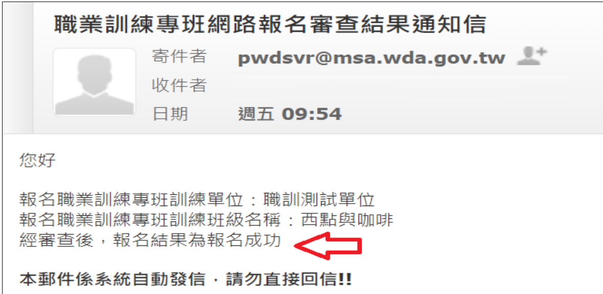
圖 4.3.2.3 報名成功通知信畫面

(2).學員報名成功，系統將發信通知報名者錄取，出現圖 4.3.2.3 報名成功通知信畫面。