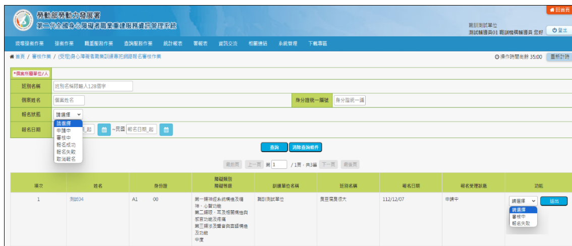
圖 4.3.1.1 (受理)身心障礙者職業訓練專班網路報名審核作業主畫面