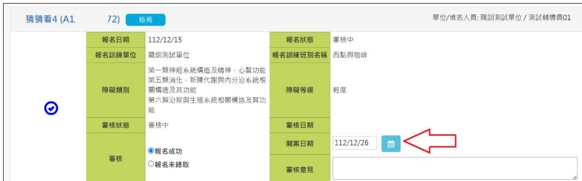
圖 4.3.1.5 填寫開案日畫面

(7).職重系統學員報名成功送出，需填寫開案日期，出現圖 4.3.1.5 填寫開案日畫面。