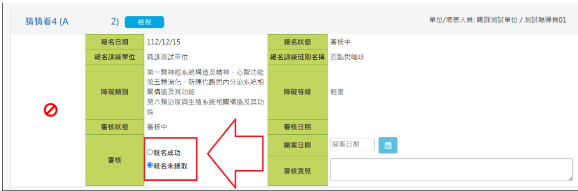
圖 4.3.2.5 重新審核畫面

(5). 職重系統學員報名成功後，學員進入職重服務作業／職業訓練作業進行職重職訓服務，出現圖 4.3.2.6 職業訓練作業畫面。