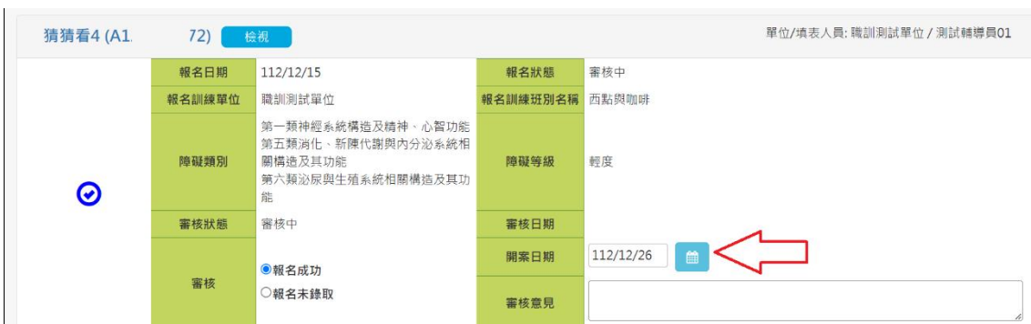
圖 4.3.2.4 填寫開案日畫面

(3).職重系統學員報名成功送出，需填寫開案日期，出現圖 4.3.2.4 填寫開案日畫面。