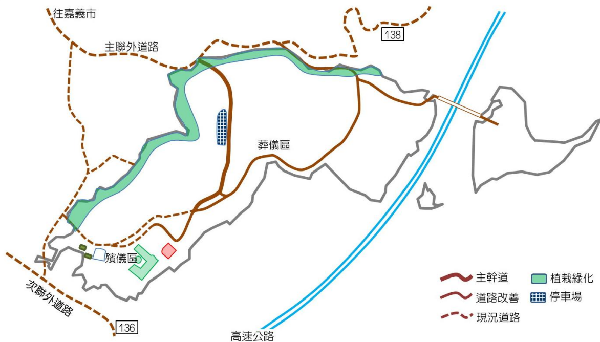
圖11-1 先期改善計畫工程配置圖

根據本計畫市場需求、工程技術、土地取得、財務與環境影響等分析評估，本計畫均屬可行計畫，惟因水上鄉居民對於園區任何變動，均恐為擴增設施，對本計畫仍多有疑慮，需時間溝通說明。現況以改善環境與交通，減輕居民所怨為當務之急。建議於本計畫先期作業期間，同時進行先期園區改善計畫如圖11-1。