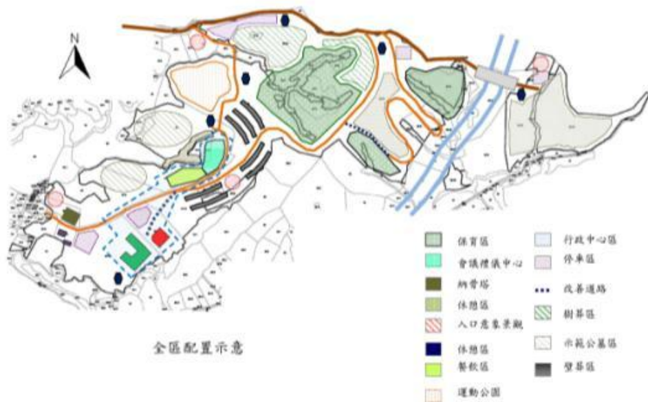
圖6-5 嘉義生命園區全區配置圖

嘉義生命園區為既有市立公墓，現有設施包括殯儀館、火化場、納骨堂、示範公墓與傳統墓地及相關附屬設施。園區規劃以服務中心區(停車空間、管理服務中心、休憩區)、主體事業區(環保多元葬區、骨灰骸存放設施)及、公用設備等為主。全區配置示意如圖6-5。