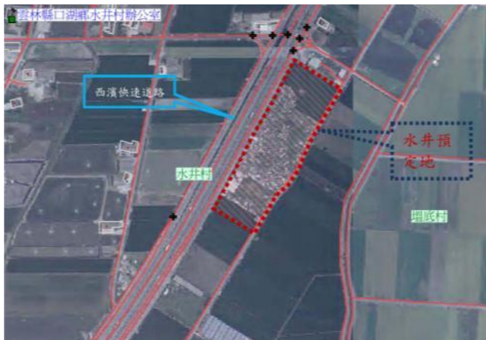
圖6-1 水井生命園區基地範圍

水井生命園區位於口湖鄉水井村，面積共計2.04公頃。園區土地屬雲林縣口湖鄉水井段221-59等七筆公私有土地，土地使用區分為一般農業區及墳墓用地。基地範圍如圖6-1。