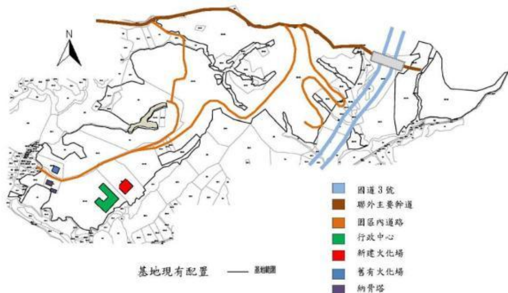
圖6-4 嘉義生命園區基地現況範圍

嘉義生命園區位於嘉義縣水上鄉，現為嘉義市市立公墓，面積共計54.8公頃。園區土地屬嘉義縣口湖鄉牛稠埔段0325等31筆嘉義市公有土地，土地使用區分為山坡地保育區墳墓用地或暫未編定地。基地範圍及現況如圖6-4。