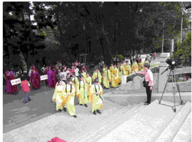
【圖 1-2-3】現場拍照記錄嘉義 2014 年祭孔大典使用公園空間情況

除了文字資料外，老照片、圖面資料和古地圖的蒐集亦不可或缺，尤其建築活動與空間組織的探討，更需要具體的空間圖像作為分析判讀的基礎，將文字與圖像資料對照解讀，方能建立完善