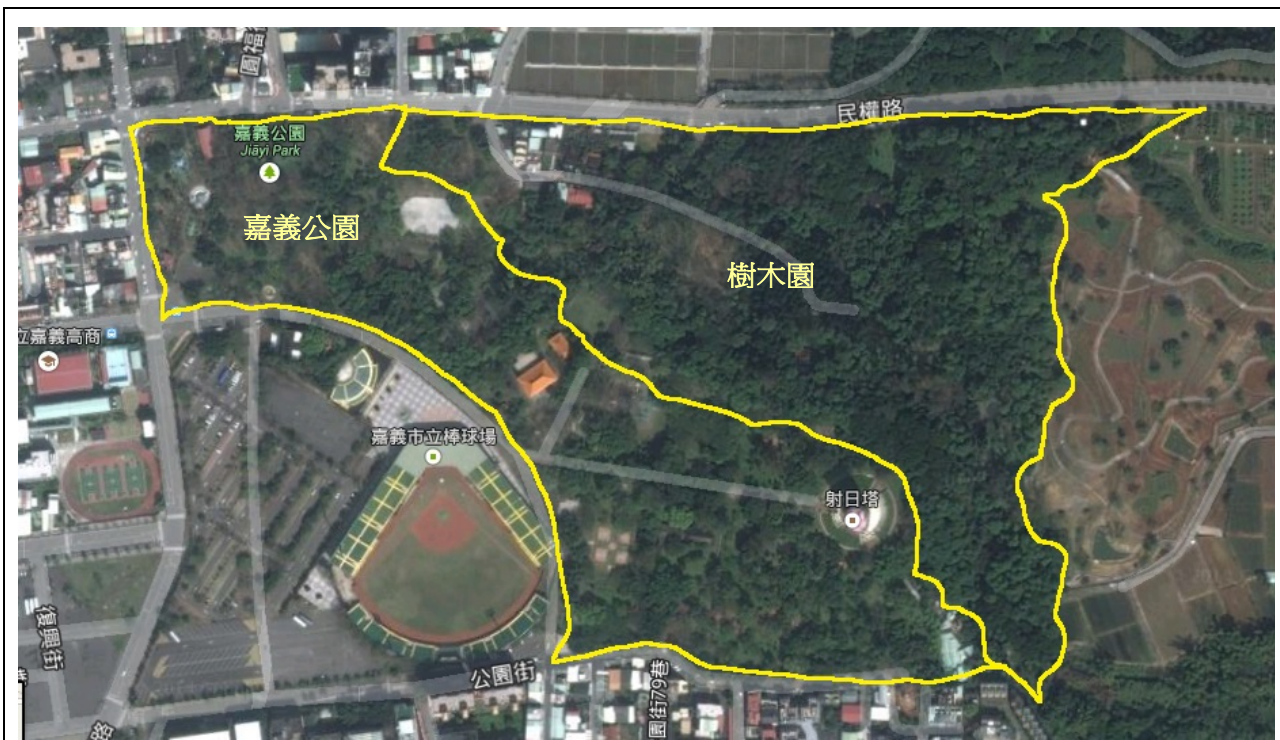
【圖 1-1-1】圖左框線內為嘉義公園，圖右框線內為樹木園