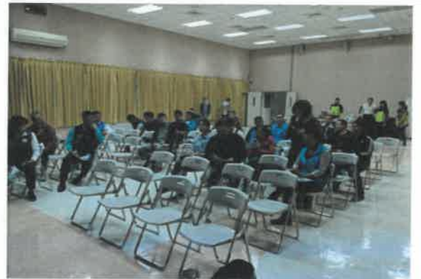
與會人員發言(中庄里)