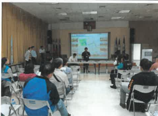
本府觀光新聞處發言