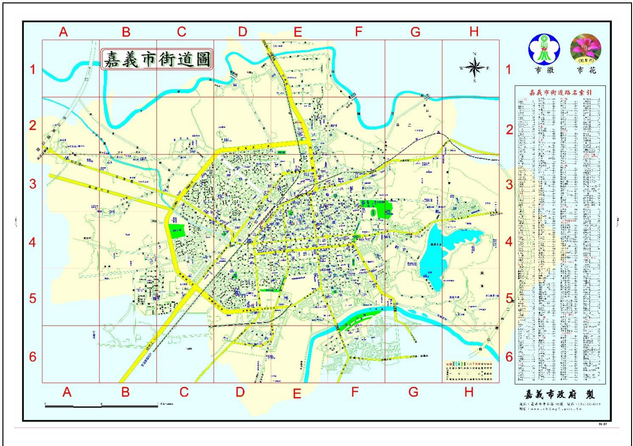
圖 2 嘉義市行政區域街道圖