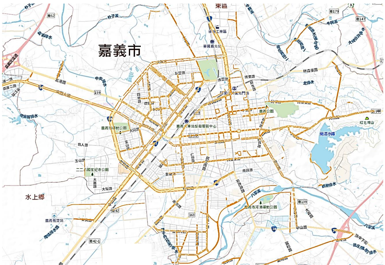
圖 3 嘉義市人行道分布圖