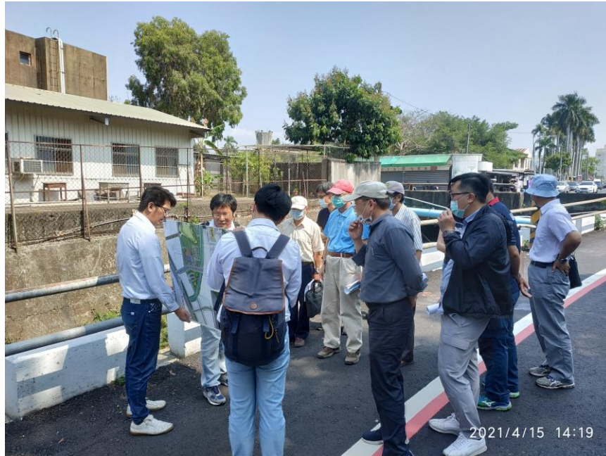
各機關代表與委員勘查提案計畫現場