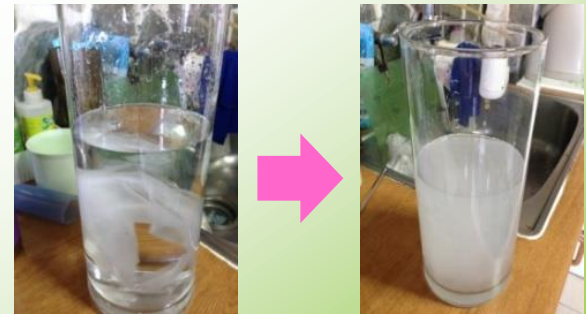
衛生紙於水中狀態