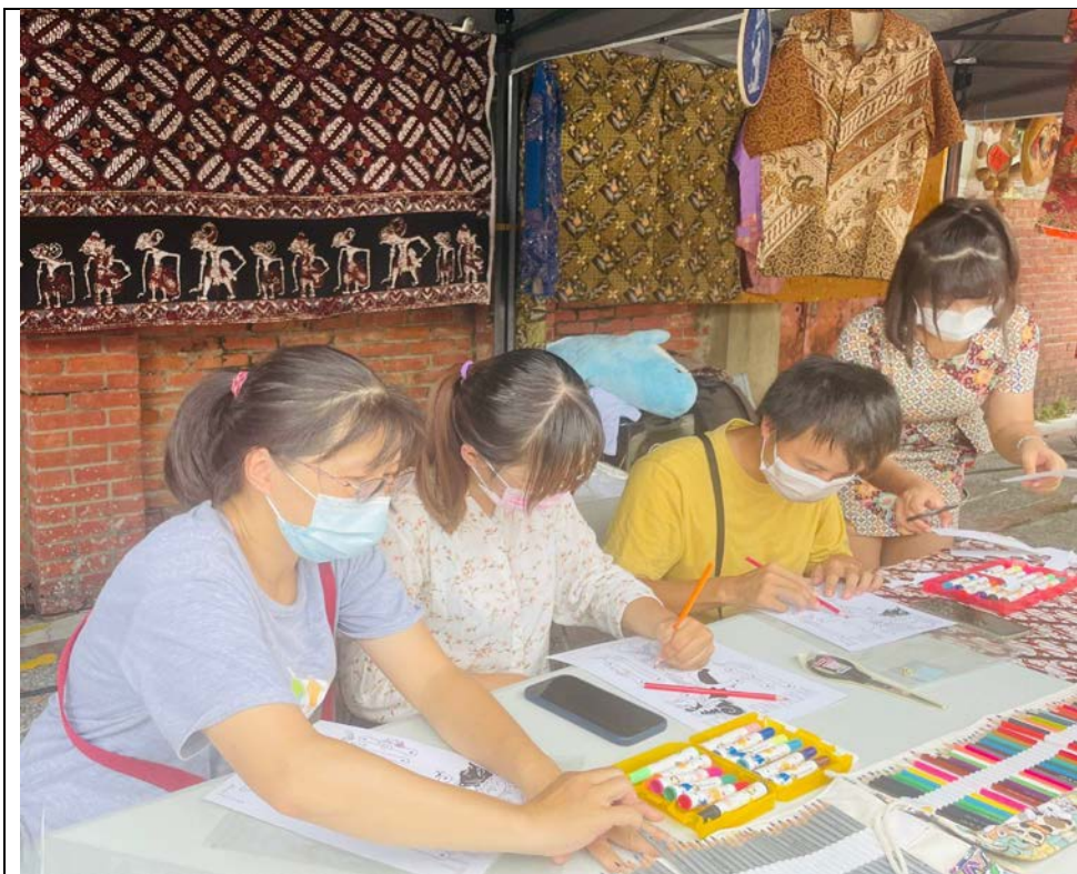
3.東南亞文化市集 DIY 手作區(手作印尼皮影戲偶) 民眾成品