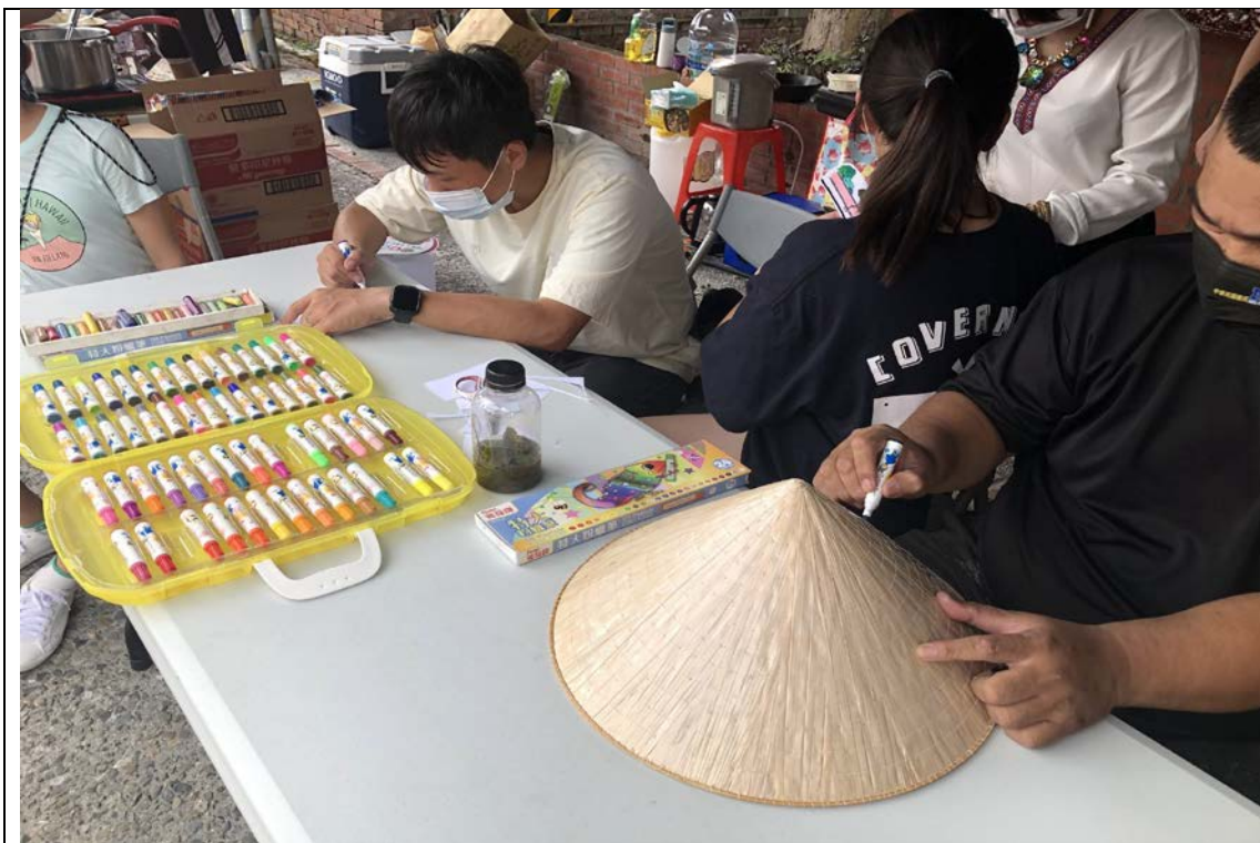
5. 東南亞文化市集 DIY 手作區(手繪越南斗笠) 民眾成品