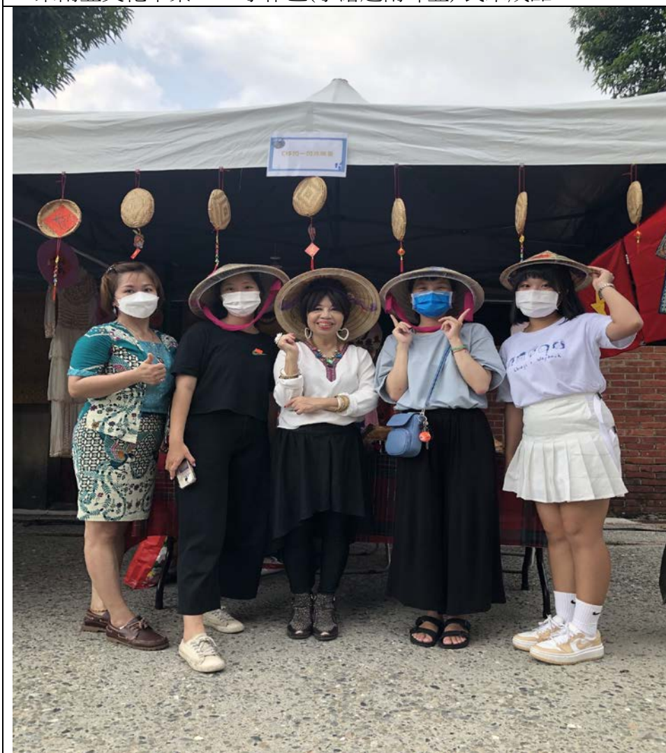
6. 東南亞文化市集 東南亞美食攤商