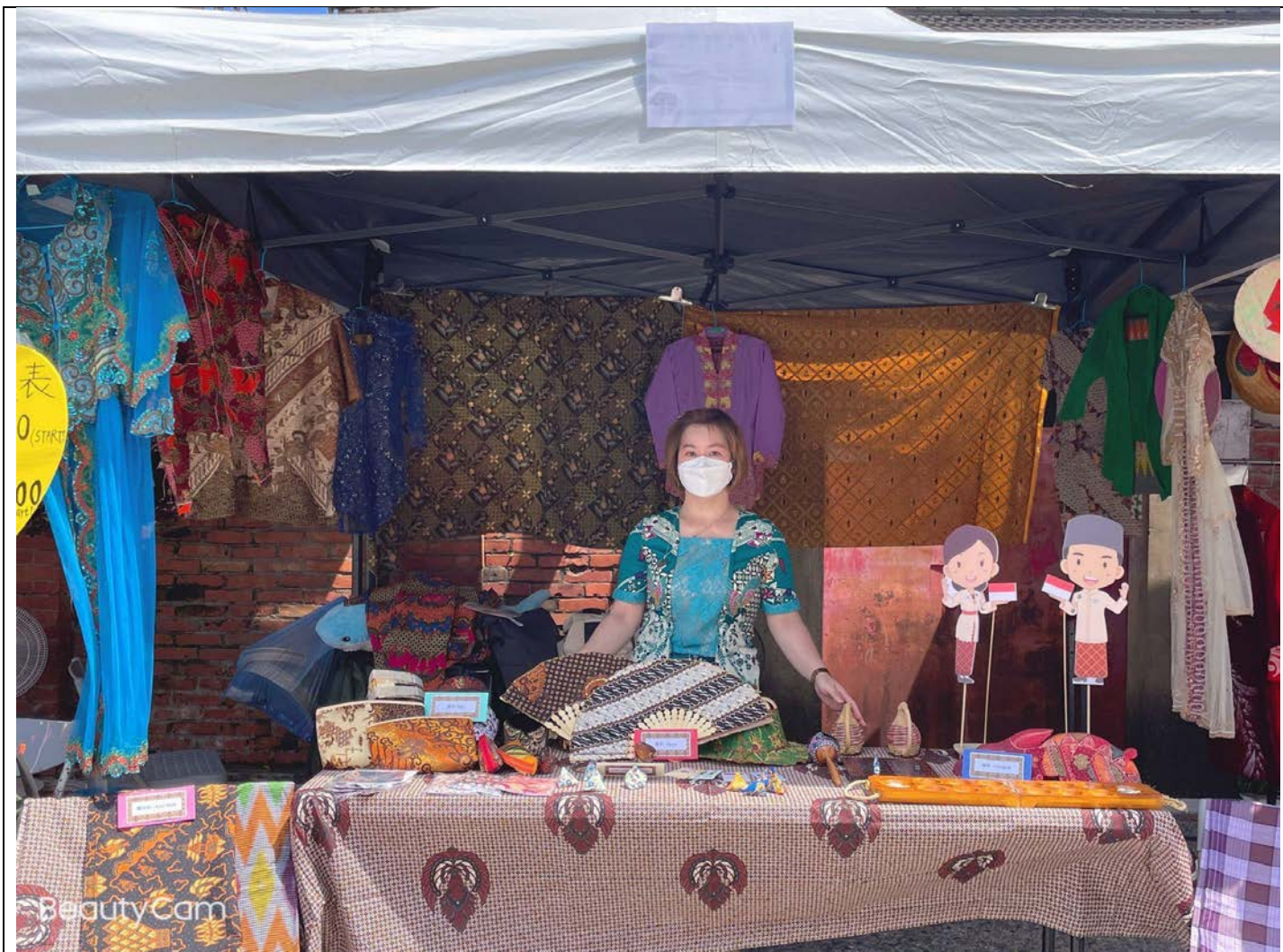
2. 東南亞文化市集 DIY 手作區(手作印尼皮影戲偶)