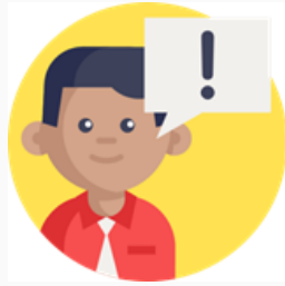
認知功能退化(語言、空間感、判斷力等等)