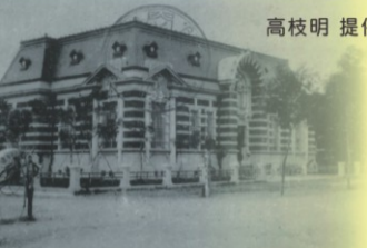
KASHI BRANCH OFFICE OF THE BANK OF FORMOSA.