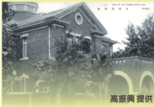
1.1.1 VIEW OF THE FORMER PUBLIC HALL