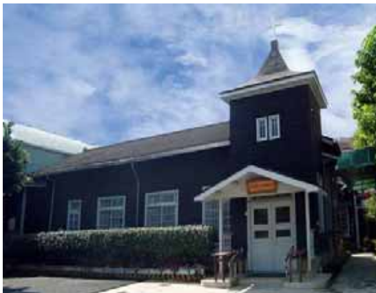
照片 1-1 禮拜堂近照

本計畫乃依《文化資產保存法》第二章第十三條明文規定：「 主管機關應建立古蹟、歷史建築及聚落之調查、研究、保存、維護、修復及再利用之完整個案資料。 」有本計畫成立後，由嘉義市文化局委託漢光建築師事務所，進行基礎資料建構、相關之調查研究與未來遷移之評估，期能記錄、研究並保存嘉義市之城市文化資產，以期增進台灣建築之歷史與文化深度。