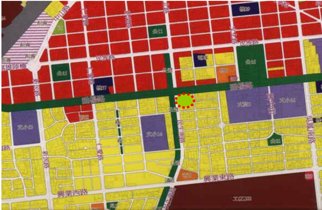
圖 1-6 嘉義市都市計畫圖(局部)(虛線圓框為本研究自行加註，為本古蹟位置)