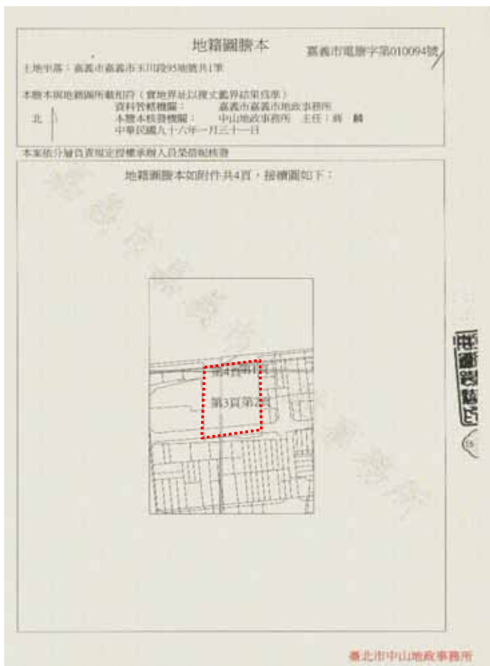
圖 1-8 地籍圖資料 (加註虛線方框為基地範圍)