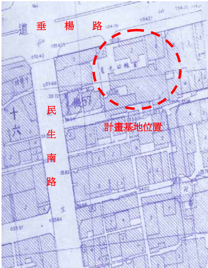
圖 1-7 基地週圍都市計畫圖 (虛線為本研究自行加註範圍)