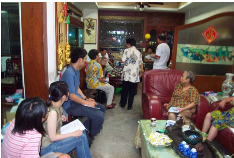
工作團隊與社區居民熱烈討論的狀況