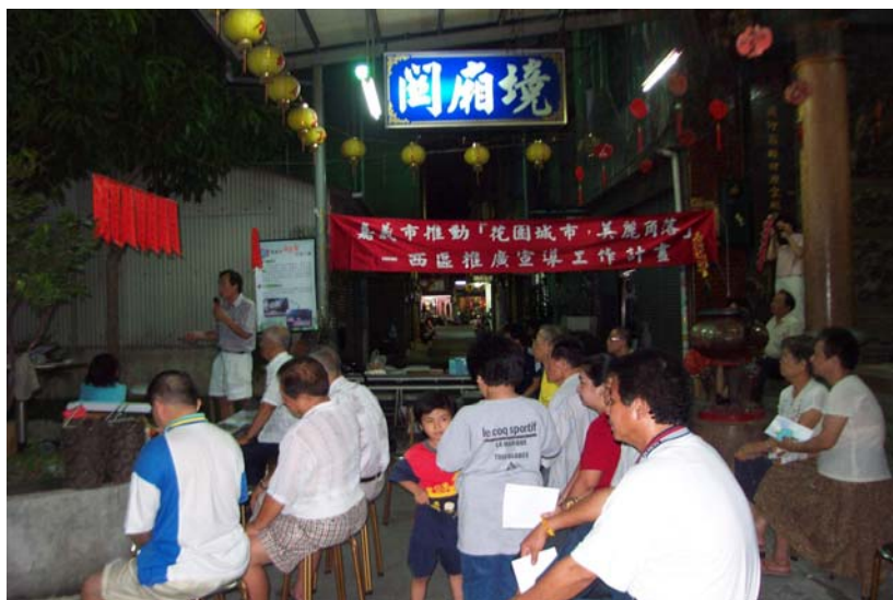
里長向居民講解規劃構想