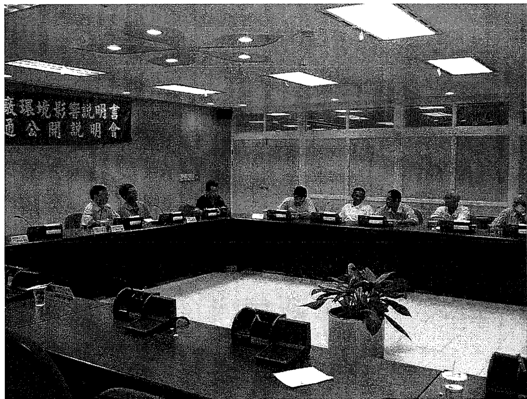
環評公司簡報及里民提出意見參與討論