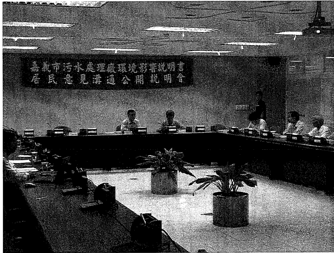
里民進場及開發單位說明