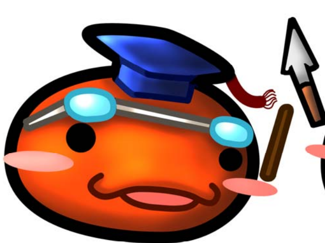
史蹟資料館 學問寶寶