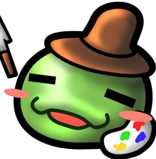
陳澄波文化館 塗丫寶寶