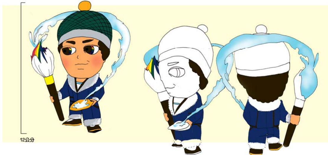
陳澄波. 二二八文化館

有人說陳澄波先生是油彩的化身，故以其作公仔設計，作一揮灑畫圖之模樣，同時更能吸引觀眾了解公仔背後的意義。