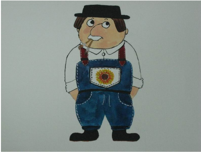
陳澄波. 二二八文化館