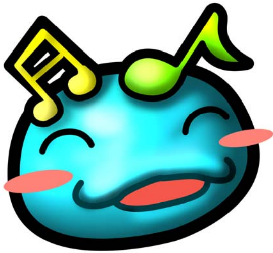
祥太文化館 音符寶寶