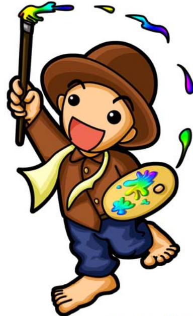
陳澄波文化館 陳小弟