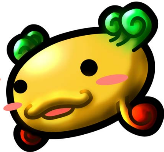
交趾陶館 粘粘寶寶