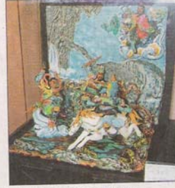
左圖：「第六屆葉王獎」第一名蔡顯勇，作品「反彈琵琶鳳來儀」。(記者丁偉杰攝) 中圖：第二名歐雪惠，作品為「天長地久（龍龜）」。(記者丁偉杰攝) 右圖：第三名侯春廷，作品為「關太師西岐大戰」。(記者丁偉杰攝)