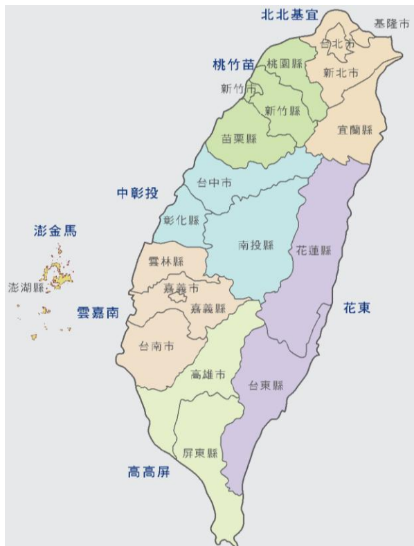
圖2-3 國土空間結構區域生活圈