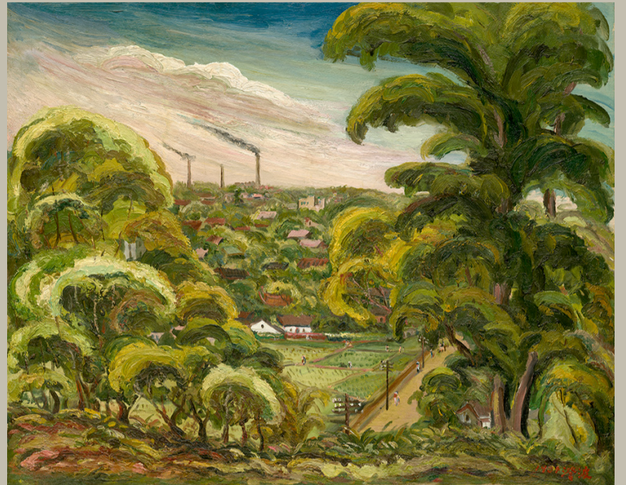
▲ 陳澄波，〈展望諸羅城〉，油畫，72.8×91cm，1934（嘉義市立美術館典藏）

沉穩的山景，因著油彩的筆觸與色澤，像是遙遠而美好的精神依靠的所在。因為西南季風水氣為山壁所阻擋，於山頂凝結成雪，也因山勢足夠高聳，孕育出溫帶植物的植被，而到了山腳下，也是陳澄波作畫所在之處，則為熱帶植物遍佈。不同氣候的自然景觀在藝術家的筆下聚集於同一幅畫面中。而在阿里山所繪的〈雲海〉霧氣繚繞，筆觸帶出山與雲瀟灑的迷濛，感覺山上潮濕的冷空氣就要撲面而來，像是阿里山上的每日風景。〈山居〉同樣水氣氤氳，彷彿罩住山頂，農夫身上的雨衣透露出山中生活適應氣候的習慣。