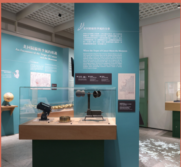
▲ 展場一隅「北回歸線與季風的交匯」。